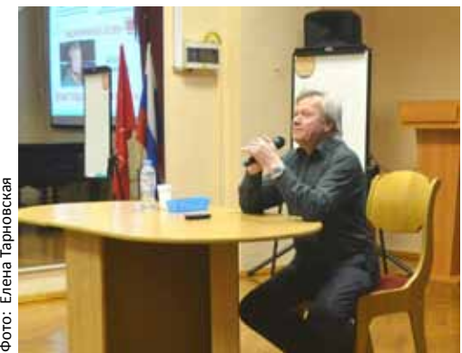
Спортивный комментатор Андрей Шестаков