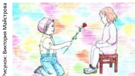
Рисунок: Виктория Майстрова