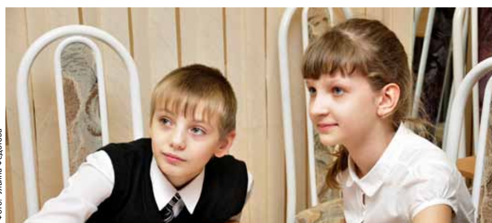
На историко-краеведческой игре «Административные районы города. Кронштадтский район»

— В олимпиаде для 9-11 классов участники также проходят тестирование по предмету «История и культура Санкт-Петербурга» и пишут исследовательскую работу. Ребята заранее выбирают тему для своей работы, консультируются, посещают библиотеки и архивы, а потом пишут серьезную работу. Участники, показавшие луч-